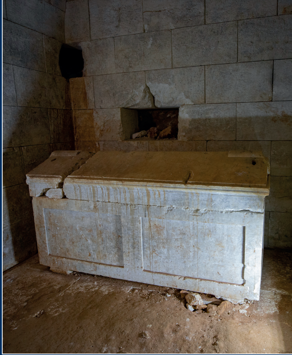
Sofraz Çayı kenarında bulunan tümülüs, 15 metre yükseklikte 50 metre çapındadır. Giriş güneyde olup kaliteli kesme taşlardan örülmüştür. Mezar odası tonuzlu bir üst yapıya sahiptir. Dromosla girilen odada 2 adet lahit bulunmaktadır. Mimari yapı incelendiğinde MS 2. yy'a tarihlenmektedir. (Roma Dönemi)