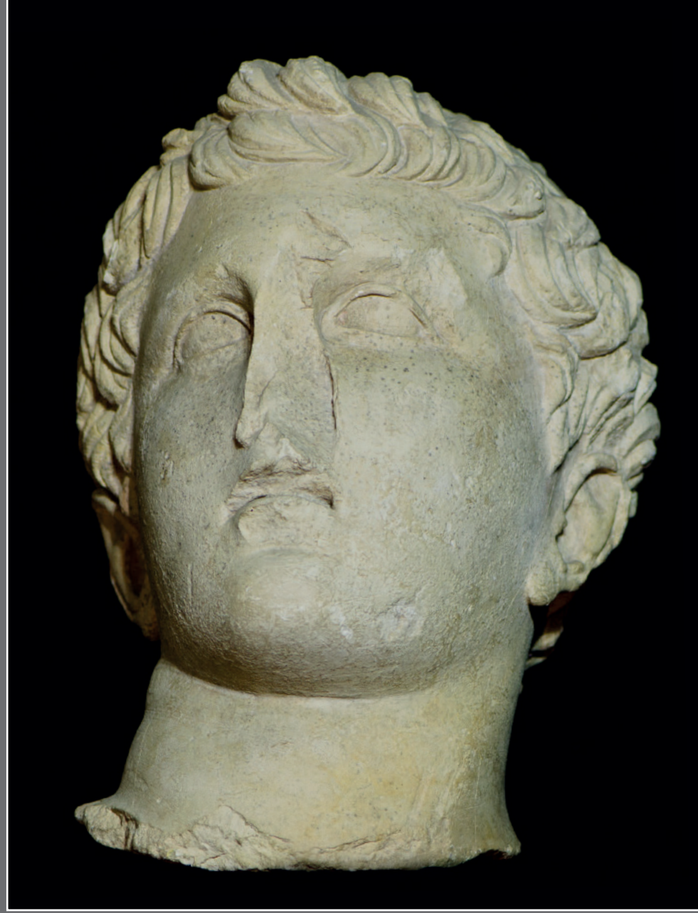
1983 yılında yapılan Samsat kazısında ortaya çıkartılan Antiochos heykelinin boyundan üst kısmı korunmuş halde olup, baş sağa doğru hafifçe dönük, saçlar kabartma olarak alev dilimleri şeklinde gösterilmiştir. Diadem arkada düğümlenmiş, sol elmacık kemiği üzerinde kitabe mevcut olup, üzerinde kırmızı boya izleri kısmen korunmuştur. Genç Kralın sol gözünün altında Antiochos yazmaktadır.