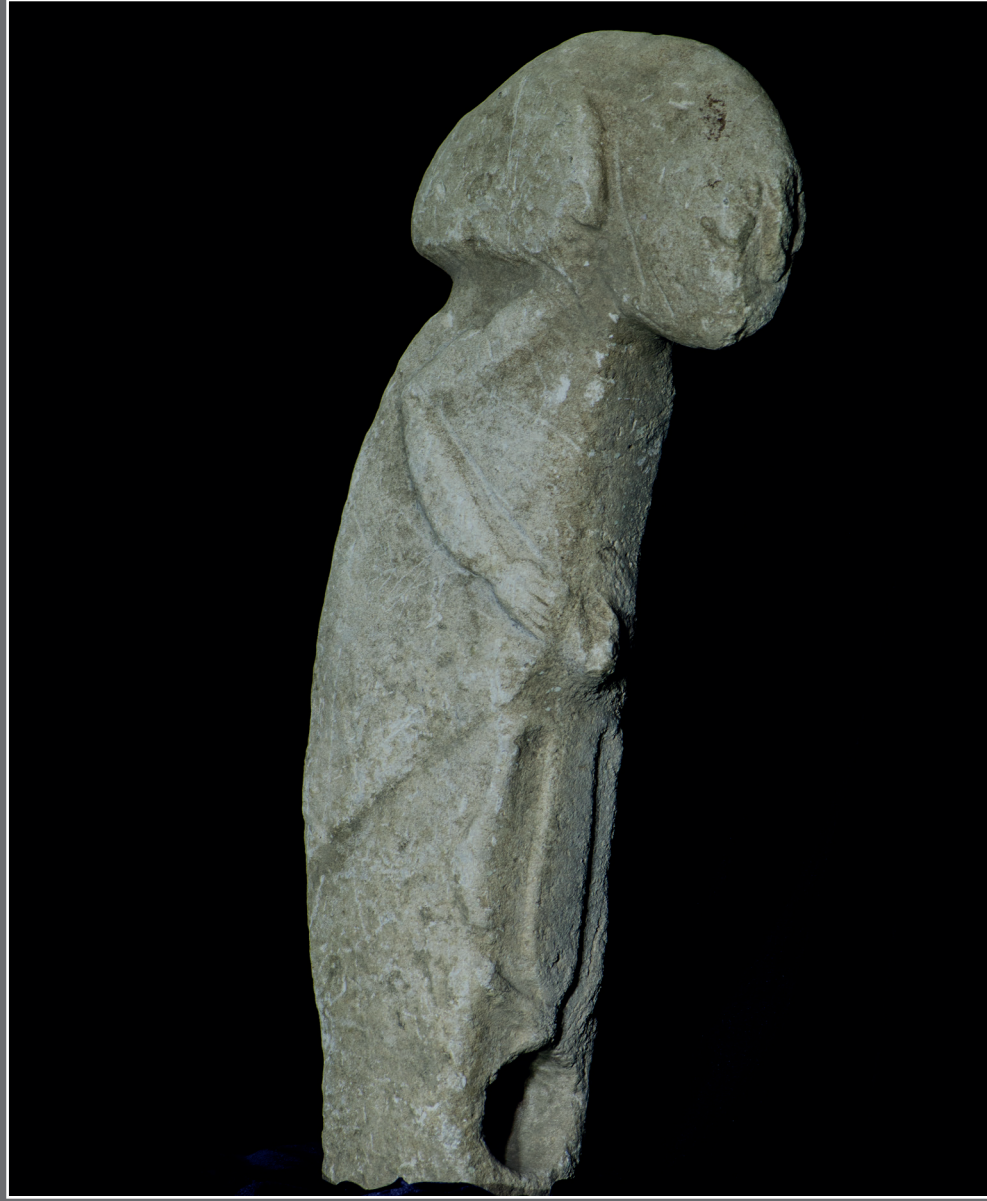
1970 yılında Káhta İlçesi'ne bağlı Çıralık Köyü Kilisik Mezrası'nda bulunan Kült Heykeli'nin Şanlıurfa Göbekli Tepe'deki heykellere benzerliği ile dikkat çekmektedir. MÖ 7500-7000 yılına tarihlenen heykel kireç taşından yapılmıştır. Kolların birleştiği gövdenin ön kısmında insan şeklinde küçük bir kabartma bulunmaktadır. Bu heykel bir kadın ya da bir tanrıçanın doğum anını betimlemektedir.