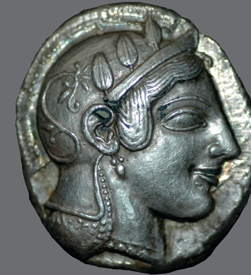
Sikke, Küçük Eserler ve İkonalar Salonu

Tamamı Perge antik kentinde gerçekleştirilen kazılarda bulunan Roma imparatorlarının heykelleri, Roma sanatının şaheserleri arasındadır. İmparator heykelleri yanında Antalya Müzesi'nin sembollerinden olan Dansöz Heykeli de burada sergilenir. Parçalar hâlinde keşfedildikten sonra birleştirilen bu heykel anıtsallığıyla birlikte ince ayrıntıları ve canlılığı ile Müze'nin en beğenilen eserlerinden biridir.