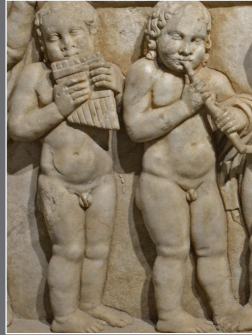
Arif Müfid Mansel'in Mirası

Side Antik Kenti'nde, MS 2. yüzyılda inşa edilmiş, MS 5. yüzyılda yenilenmiş bir Roma hamamı içerisinde yer alan Side Müzesi, beş salon ile geniş bir avludan oluşuyor. Hamam olarak kullanıldığı dönemlerde, banyonun farklı aşamalarında girilen Soğukluk (Frigidarium), Sauna (Laconicum), Sıcaklık (Caldarium) ve Ilıklık (Tepidarium) bölümlerinin her biri bugün sergileme salonu olarak hizmet veriyor. Yani, sergilenen eserler yanında müze binası da ziyaretçileri zamanda yolculuğa çıkarıyor. Müze'nin bir diğer özelliği, Türkiye'de bir köyde açılan ilk müze unvanını taşıması.